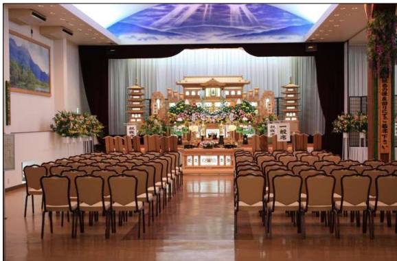
大ホール 【収容人数100名程】 一般的なお葬式にご利用頂けます。