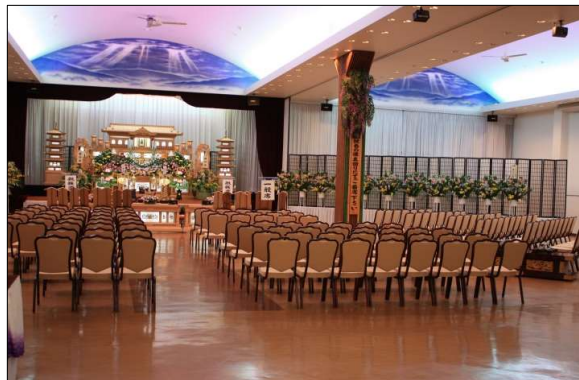
全館ホール 【収容人数400名程】 100名をこえる大きなご葬儀に 対応させて頂きます。