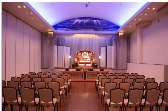
小ホール 【収容人数50名程】 家族葬などのご葬儀に ご利用頂けます。